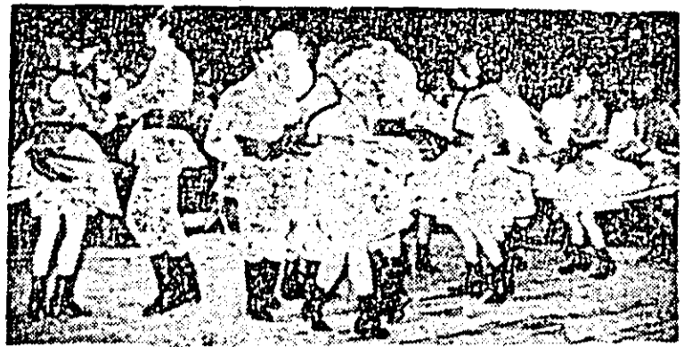
Îndrăgii ansamblu folcloric al întreprinderii de vagoane Arad într-o evoluție caracteristică.