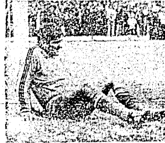
Răducanu... Invins la Arad! Imagini din meciul victorios al formației U.T.A. cu Sportul studențesc București.

Și în prima repriză arădenii au avut inițiativa, gresînd însă prea des prin jocul aglomerat pe cea-