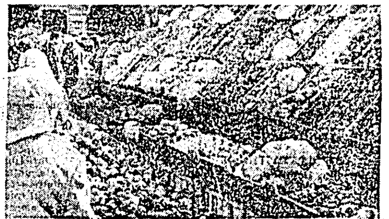
De ziua recoltei, în piețele Aradului au fost amenajate bogate expoziții de produse agricole.