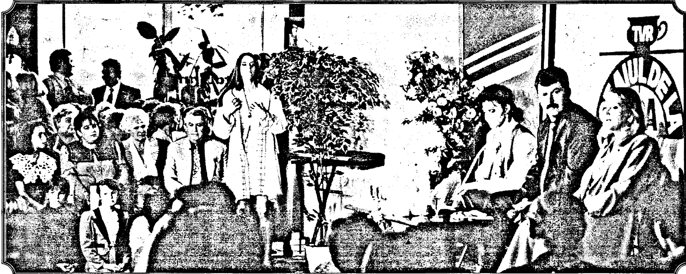
Aradul a dovedit că poate face un „Cei” din cele mai bune. După noi, a fost un „Cei” tare. (Informații și relatări detaliate în pagina a 11-a)

Anul VII, nr. 1469 • Vineri, 5 mai 1995 • 16 pagini • 300 lei • ISSN 1220 - 7489