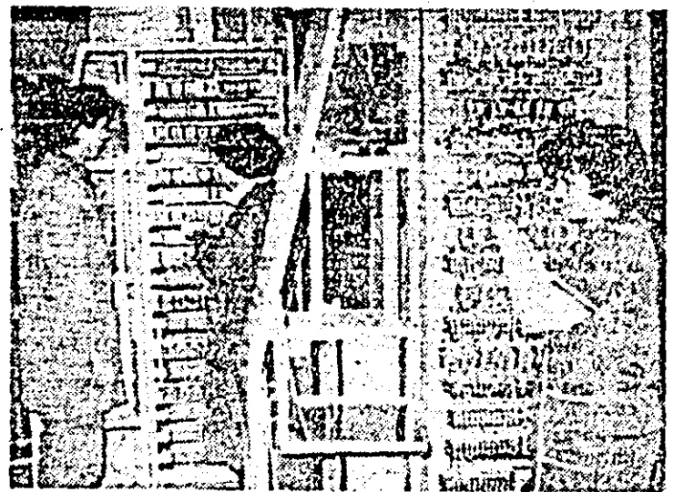
Aspect de muncă în atelierul tablourilor electrice pentru metrou al Întreprinderii de vagoane.