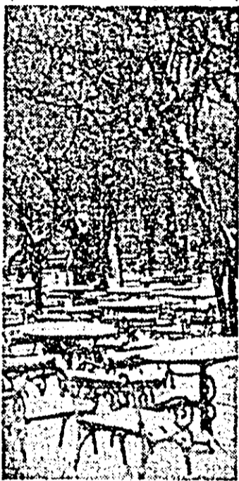
Iarna in parc.

Inv. FLOAREA OPRUT, Școala Generală nr. 20 Arad