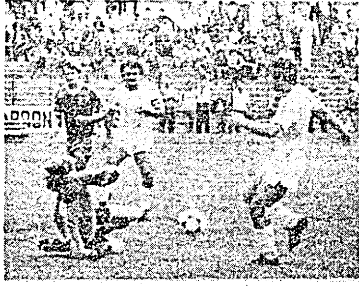
Fază din meciul F.C.M. „UTA“ — Avintul Reghin.

Avind în vedere — desigur — lipsa de implicații deosebite în ce privește configurația viitoare a clasamentului, partida a început cu preocupare pentru atac de ambele părți, jucătorii acționând pe spații largi și cu destulă cursivitate. Fără de unele evoluții anterioare, arădenii s-au mișcat mai mult în teren, cu și fără balon, au impus un ritm mai alert circulației mingii. De prin min. 10, F.C.M. „UTA“ se impune, atacă susținut obligându-l pe partenerul la o de-