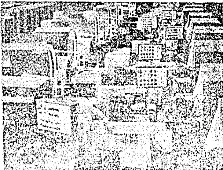
I.M.U.A. Un nou lot de mașini-unelte este pregătit pentru a fi expediat beneficiarilor externi.