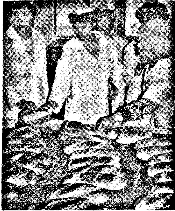
În fotografie: A ieșit prima...