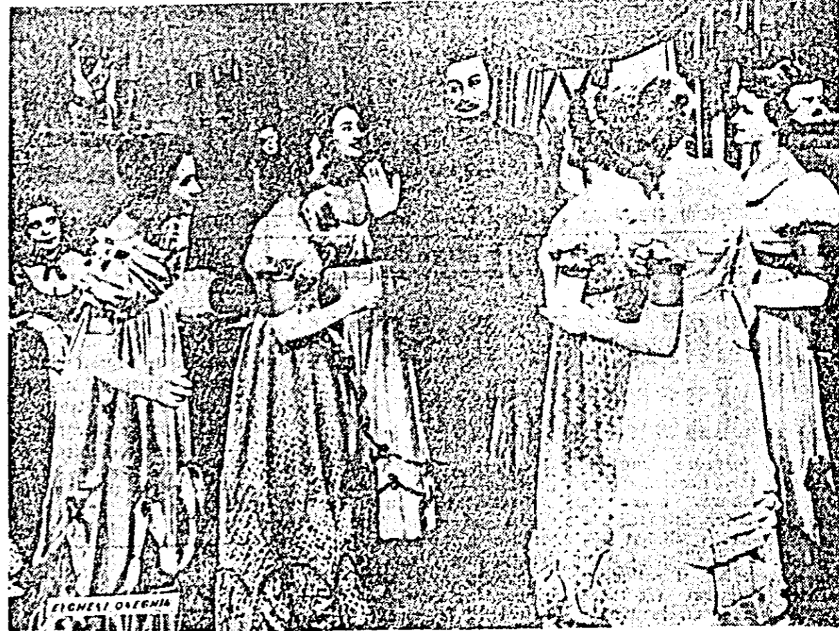
Pe ecranul cinematografului „Gh. Doja”

Aceste două dispozitive s-au experimentat și au fost aplicate la întreprinderea de industrie locală „Republica” din Reghin, urmînd ca aplicarea lor să fie extinsă în anul 1960 la toate morile din Regiunea Autonomă Maghiară. Institutul de cercetări științifice pentru protecția muncii a trimis documentația, la cerere, și altor statuti populare regionale.