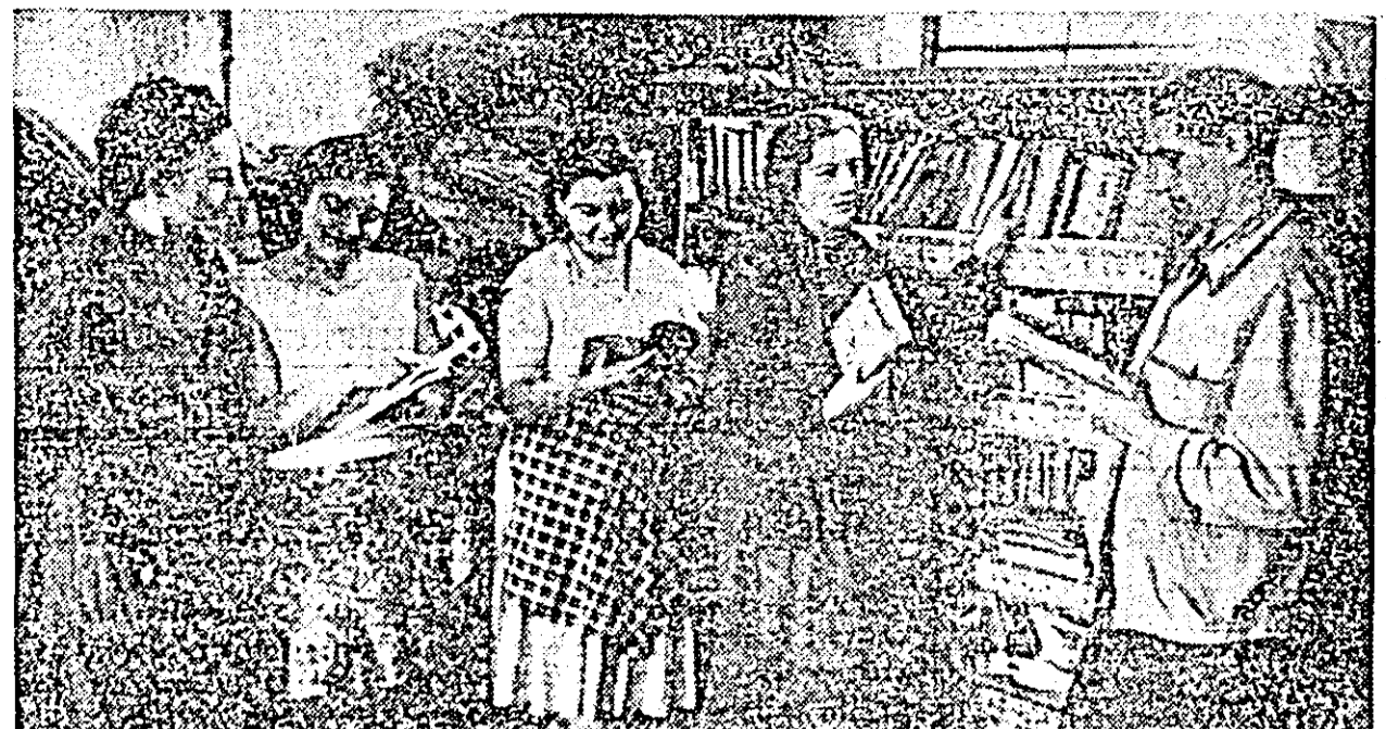
De la I. C. O. A.