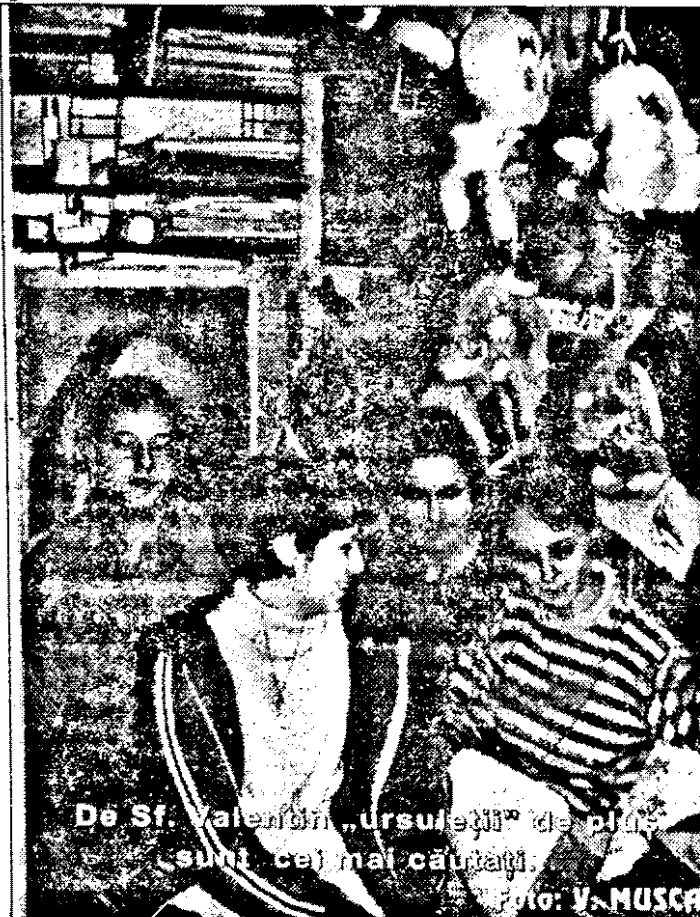
De Sf. Valentin „ursuleții” de plumb sunt cei mai căutați.