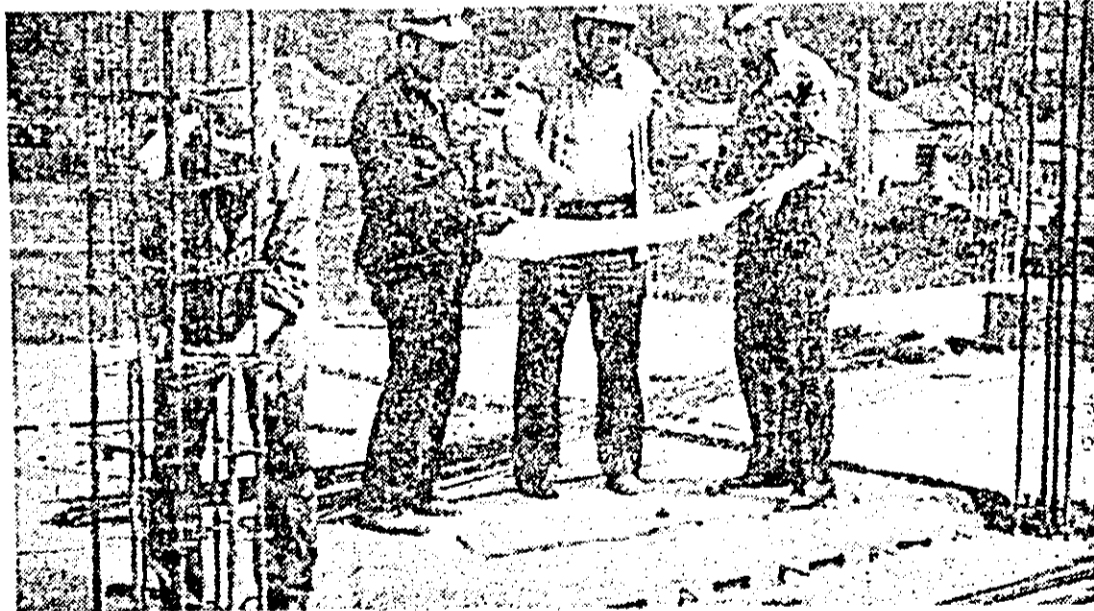
Secvențe de muncă de pe șantierul unui bloc de locuințe ce se construiește în Lipova.

• Intre 1 și 16 iulie, peste 1200 de pionieri și școlari din municipiul și județul nostru și-au petrecut o parte din vacanță în taberele de la Constanța, Avram Iancu — Alba, Valea Leșului — Bihor, Săliște — Sibiu, Bellș — Cluj, Poiana și Valea de Pești din Hunedoara. De asemenea, în tabăra centrală de creație tehnico-științifică de la Arbănaș — Buzău au fost trimiși câștigătorii fazei județene a concursului „Start spre viitor”, iar în tabăra „Speranțelor olimpice” din Constanța — echipajul de tir „Pionierul” al Casei pionierilor și școlimilor patriei din Arad, campionul etapei finale pe țară la tir din cadrul „Dacladei”. • Sub genericul „România socialistă — trecut glorios, prezent creator, viitor luminos”, un grup de 50 de pionieri de la Casa pionierilor și