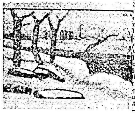
Gh. Docmanov: „Bărci la uscat pe Mureș”.