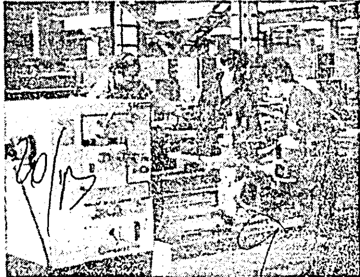
I.M.U.A. — secția montaj. Se fac ultimele verificări la un nou lot de strunguri.

Deși contribuția la obținerea acestor succese este generală, colectivele cooperative-lor meșteșugărești „Arta meșteșugurilor”, „Artex”, „Precizia”, „Mureșul”, „Lipova” și „Lucea” au avut o contribuție în mod deosebit.