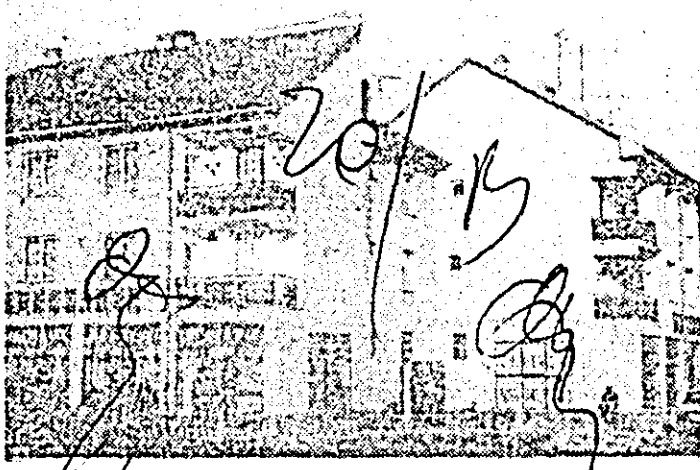
Un ansamblu de locuințe care prinde contur.

piilor noștri, contribuie peste 100 de cadre didactice; avem o bibliotecă cu 23.000 de volume, cămin cultural, club, cinematograful, formații artistice puternice laureate ale mai multor ediții ale Festivalului național „Cîntarea României”, dar mai ales avem programe de dezvoltare ambițioase pentru viitor și vom depune toate eforturile, avînd certitudinea că ele vor deveni realitate.