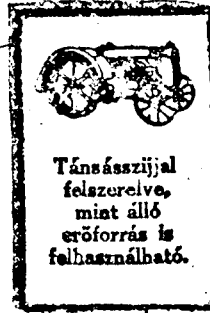
Társasázzijal felszerelve, mint álló erőforrás is felhasználható.

Berlinből jelentik: A nemzetközi kokaincsempészek ellen folytatott bünyvadi eljárás az utolsó napokban szenzációs leleplezéseket hozott. Bebizonyosult ugyanis, hogy az államügyészség szakértője, Hahn gyógyszerész, az államügyészség megbízásából tizszázalékos részesedéssel adta tovább a törvényszék által elkobzott kokaint. Berlin nyilvánossága feszült érdeklődéssel várja most a maga nemében egyedülálló láncke reskedés részleteinek felderítését.