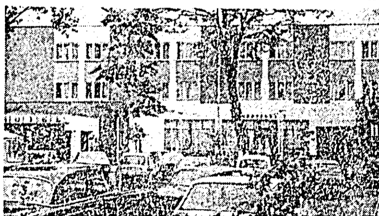
Invitație la un agreabil loc de popas — „Hanul de la răscruce”.

cum și a energiei geotermice (în unele zone apele termale sînt utilizate pentru încălzitul locuințelor sau serelor) se cer a fi aprofundate și extinse prin angajarea unor intense cercetări interdisciplinare coordonate — așa cum prevede Programul-directivă — în scopul punerii la punct a tehnologiilor capabile să permită exploatarea comercial-industrială a acestor noi surse de energie. Totodată, potrivit Programului-directivă, va fi dezvoltată colaborarea internațională pentru asigurarea utilizării mai rapide și eficiente a surselor noi de energie (ca de pildă cooperarea cu U.R.S.S., R.P. Bulgaria și Turcia în cercetarea posibilităților de valorificare a energiei valurilor Mării Negre, sau cooperarea cu alți țări ale lumii, inclusiv state occidentale industrializate, în promovarea tehnologiilor moderne, necesare exploatarea pe scară largă a energiei solare, biomasei etc.). Pe plan general, se prevede ca aceste surse noi de energie, împreună cu resursele energetice recuperate să albe o contribuție în balanța energiei electrice de 5 la sută în 1985, de 10 la sută în 1990 și de cel puțin 20 la sută în anul 2000.