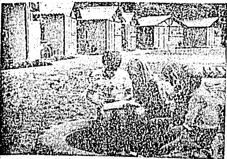
În tabăra de copii a lucrătorilor din agricultură de la I.A.S. Ulviș.