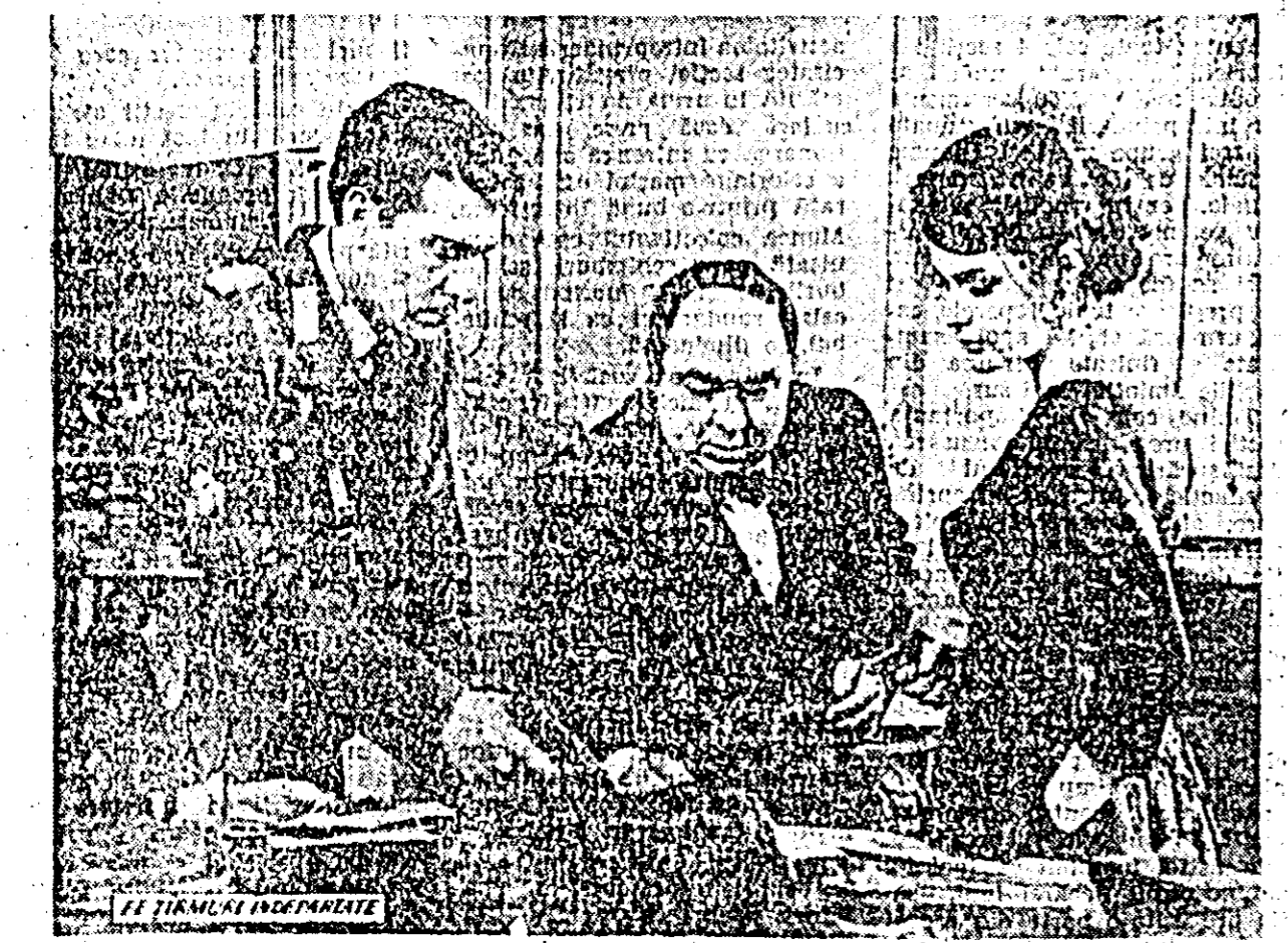
O scenă din filmul sovietic „Pe țărmuri îndepărtate” care rulaază pe ecranul cinematografului „Nicolae Bălcescu”.

Întreprinderea 4 CONSTRUCȚII din Arad str. Dobrogeanu Gherca 14 angajează imediat ZIDARI, DULGHERI ȘI FIERARI BETON