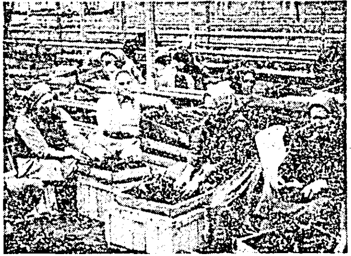
La ferma legumicolă a C.A.P. Aradul Nou se lucrează în aceste zile la replicatul în ghivece nutritive a răsădului de varză timpurie.

La situația pe locul IV pe țară, cu pondere în livrările la fondul de stat. Despre pasiunea, dăruirea și priceperea cu care au muncit horticoltorii arădeni în anul ce a trecut pentru realizarea acestei performanțe, dar și despre neîmpliniri, despre răspunderea deosebită ce li revine în pregătirea temeinică, încă din aceste zile, a producției anului curent, în obținerea unor recolte superioare, care să satisfacă pe deplin necesitățile de aprovizionare ale oamenilor muncii, ne-am propus să vorbim în rândurile care urmează.