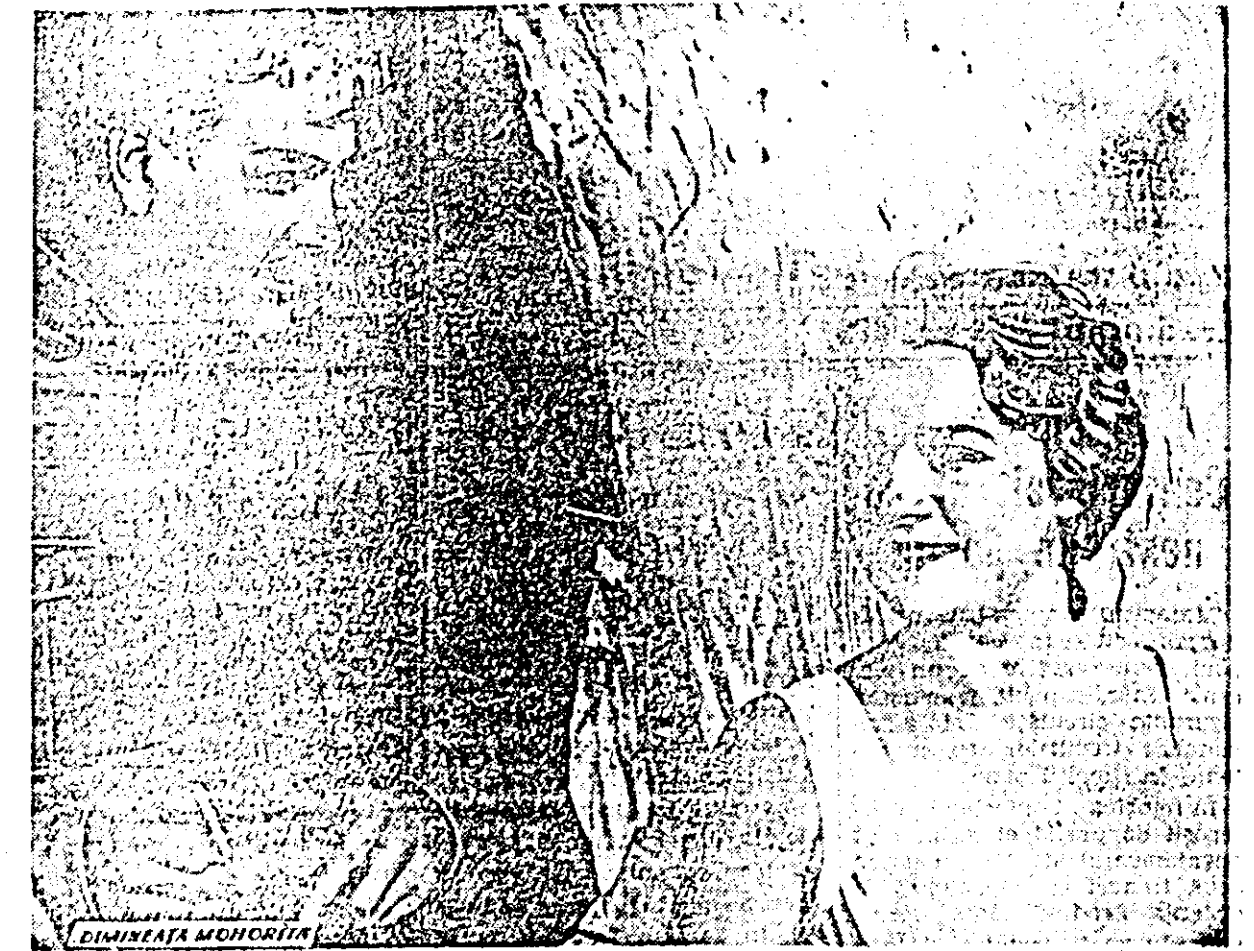
Pe ecranul cinematografului "N. Bălcescu"

Pe terenul F. Z. din localitate, formația de juniori a asociației UVA (Amefa) a întâlnit echipa de aceeași categorie ICA.