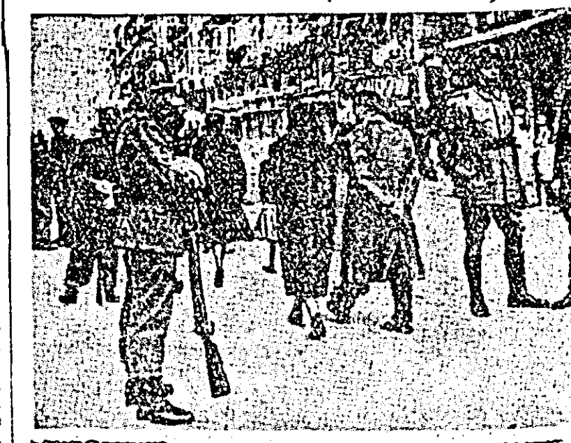
MADRIDUL AZI. Soldați înarmați și poliști pe străzile spanole, iată pe ce se sprijină franchiștii. „Viața Spaniei” se deosebește foarte mult de cea înfățișată în gazetele, cărțile și filmele docile regimului franchist — aceasta este explicația pe care o dă clișeului de mai sus revista italiană „Europea”.

MEXICO CITY. — După cum relatează Agenția Franceză de Presă, bilanțul oficial al uraganului care a bintuit o vastă zonă a coastei occidentale a Mexicului este de 1400 de morți, 208.000 sinistrați și pagube ce se ridică la trei miliarde cincisute milioane pesos. În portul Manzanillo se înregistrează 275 de morți, iar din cei 1471 de locuitori ai localității miniere Minatitlan peste 800 au perit sub o adevărată avalanșă de pămînt și noroi provocată de inundații. Din cei 51 de locuitori ai cătunului Perota numai unul a reușit să se salveze.