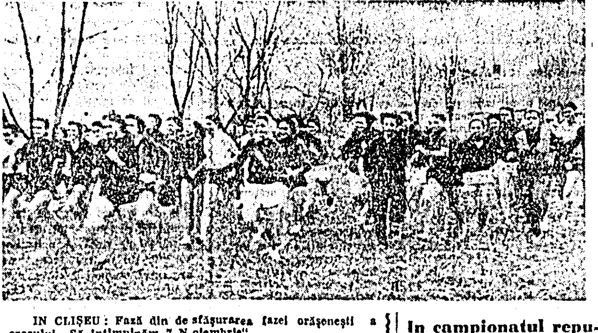
IN CIȘȘEU: Fază din desfășurarea fazei orășenești a crosului "Să întâmpinăm 7 Noiembrie".

Produsele de mai sus se găsesc de vânzare în magazinul de desfacere, str. Frantz Liszt.