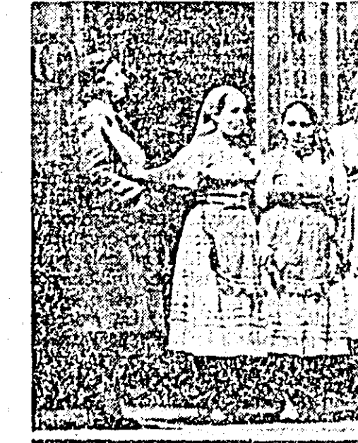
IN CLIȘEU: brigada artistică de agitatie de la „Prodalment”.