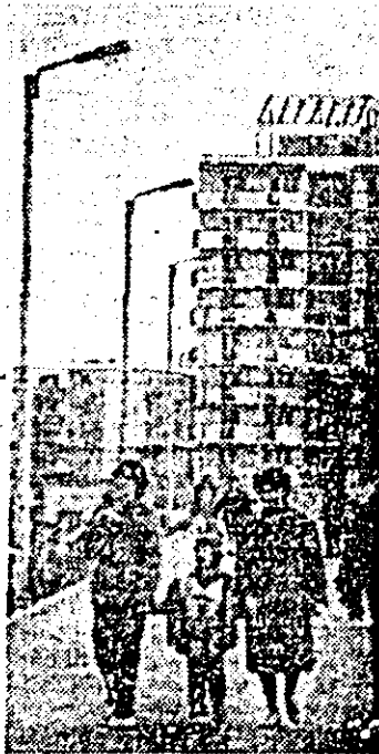
Blocul noul de locuințe în zona pasaj II.