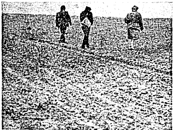
La C.A.P. Firiteaz, în căutarea sticlei de zahăr care n-a răsărit...

(Urmare din pag 1) vedea cum lucrează. Constatăm că sapa taie plante la împlinare și cele ce trebuie eliminate și cele ce ar trebui lăsate pentru a realiza o densitate de peste 80000 la hectar. În urma ei rămîn doar 67000 plante la hectar, conform calculului făcut de ing. Bogdan. Și asta numai dacă punem la socoteală și plantele minuscule, abia detectabile vizual. Dar vorba dumneacel, din plantă mică se face sfeclă mare. Dacă se mai face, adăugăm noi. Sfecla de zahăr este amplasată în totalitate în ferma nr. 2. Dorim să vedem cum stau lucrurile și la cultura porumbului, în ferma nr. 1, unde, zice șefa fermei că nu s-ar putea lucra. Drept pentru care o invităm să amine. Intocmitul scriptelor și să ne însoțească în teren. Numai că ideea de a se deplasa în câmp îi displace profund tovarășei. — Vă însoțesc în câmp, ne spune ea, dar numai cu o condiție. — S-o auzim. — Mă duceți cu mașina dumneavoastră, vedeți ce-l de văzut și mă aduceți îna-