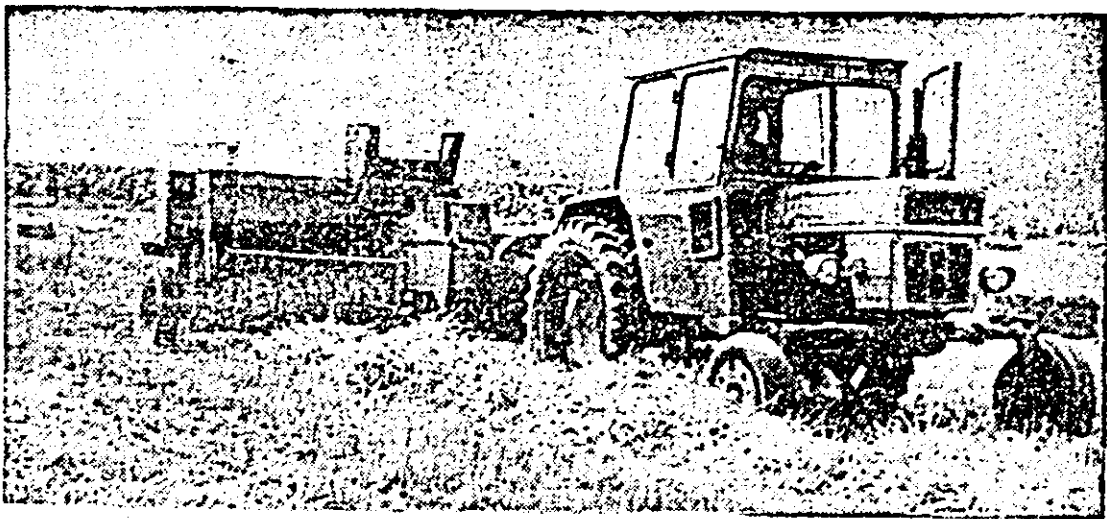
La CAP Vinga se acționează intens la balotatul piștelor de orz.