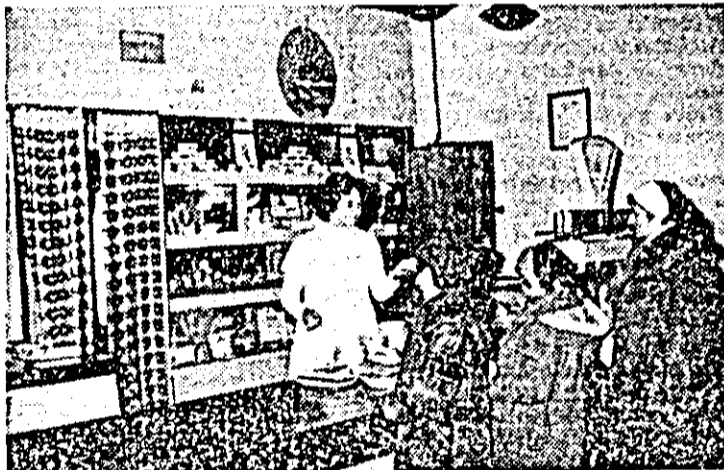
Indiferent de anotimp, cotelăria din stațiunea Monca-sa se află permanent în „plîn sezon” și asigură consumatorilor o servire ireproșabilă.