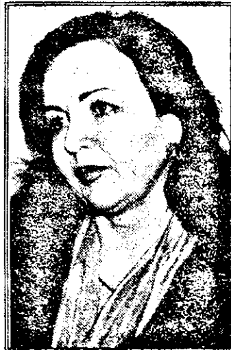
— Ce ați realizat ca deputat în acest timp?

— Eu am credința că în acest înalt for legislativ, desigur, voturile le-au adus, dar la bătăut de cântecul meu. Oamenii m-au știut pe mine, cea care cântă și probabil că și-au spus: acest om, dacă are preocupări atât de calde, cum este cântecul, nu poate să facă acolo lucruri care să nu ne slujesc. Eu cred că datorce aceste două mandate cântecului.