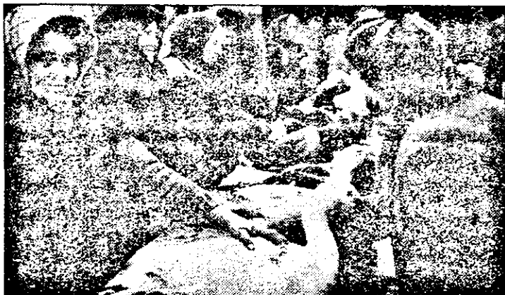
„Nu, măică, nu-i Lili, lebăda de la balastiera Ceala, îi gânsacu' îndopat dă mine...”

De aproape o lună de zile, Fabrica de hârtie „Letea” Bacău - principalul producător de hârtie de ziar din țară - se află într-un proces de rețehnologizare.