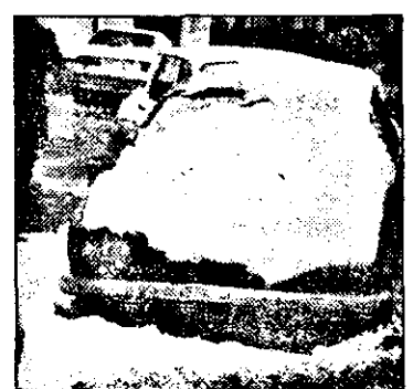
De aproximativ o lună, mașina din imagine a fost pur și simplu abandonată în fața redacției noastre. Are numărul de înmatriculare 5-AR-1370. Proprietarul este invitat să și-o ridice. Altfel, anunțăm organelle abilitate să elibereze carosabilul.