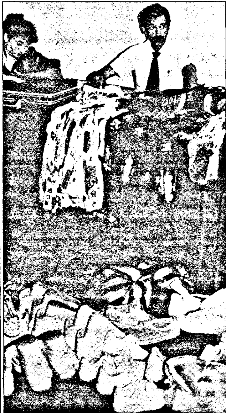
Viață grea, pentru comercianții certați cu legea: verificări de acte, inventare, procese-verbale, amenzi contravenționale, cercetări penale...