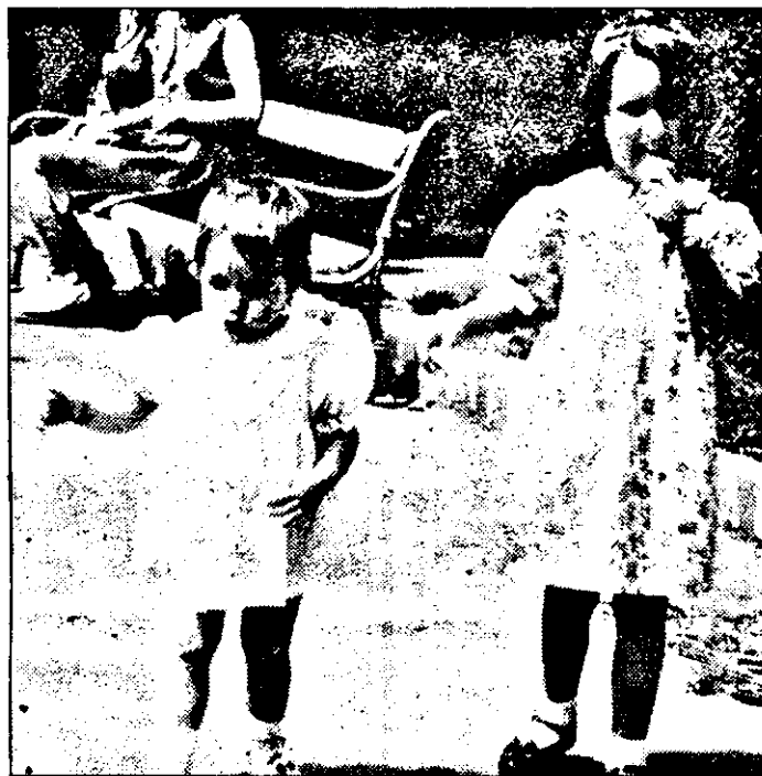
Eu de ce nu am primit înghețată?

◆ Măine, sâmbătă, 1/2 august a.c., între orele 19,30-7,30 va fi de gardă Farmacia 72, B-dul Revoluției, telefon: 254336.