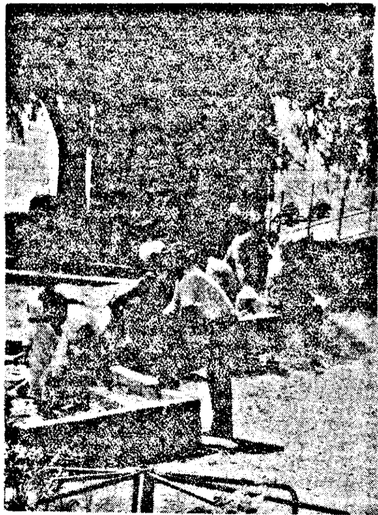
Să mai uităm de grijile zilnice...

INTREBARE. Mai mulți cetățeni ne-au întrebat, și întrebăm și noi Primăria, unde este punctul de colectare a ajutoarelor pentru sinistrații din Moldova. Așteptăm răspuns.