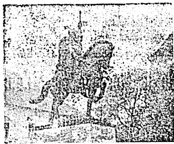
Statuia lui Mihai Viteazul din Alba Iulia, care evocă marelui act al Unirii întărit la 1 decembrie 1918.