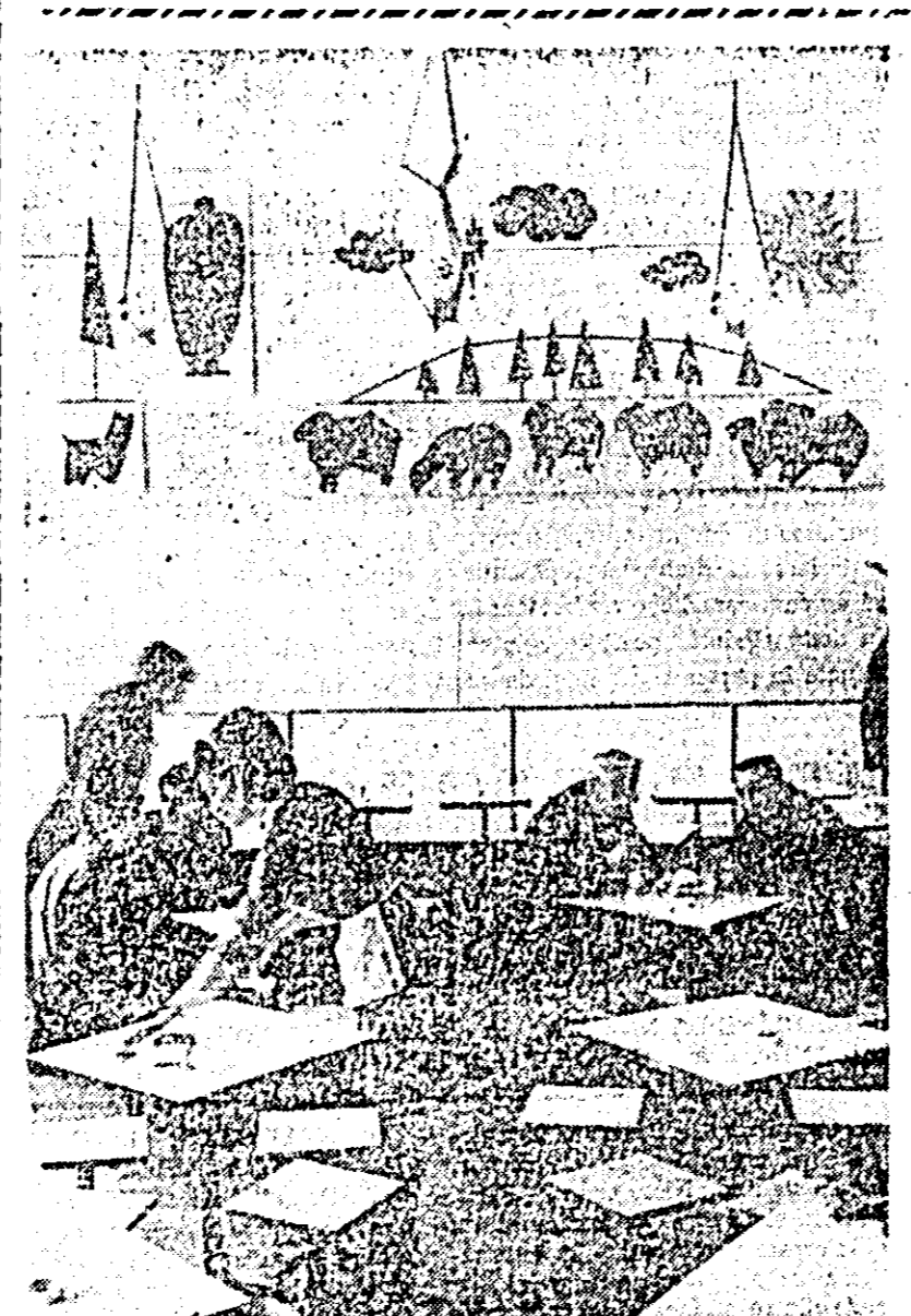
Noua unitate lacto-vegetariană deschisă recent pe B-dul Republicii.

Cu toate că observațiile notate mai sus au fost constatate în cadrul schimbului doi, asemenea aspecte pot fi întâlnite și în alte schimburi. Încă nu s-a făcut totul pentru imprimarea unei discipline corespunzătoare în producție, pentru folosirea cu maximum de randament a capacităților existente și a raționalizării fluxului tehnologic. Rezumativ, sint rezerve importante în direcția organizării producției și a muncii. De aceea, se impune luarea unor măsuri hotărîte, bine gândite, avînd în vedere timpul scurt care a mai rămas pînă la finele anului, măsuri care, conjugate cu hotărîrea întregului colectiv, să conducă la realizarea integrală a sarcinilor de plan.