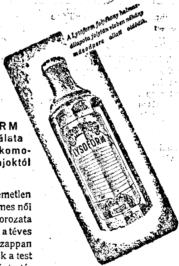
A Lysoform folyékony hatóanyag állapotában vízben néhány másodperc alatt oldódik.

A LYSOFORM állandó használata megóv a legkomolyabb női bajoktól