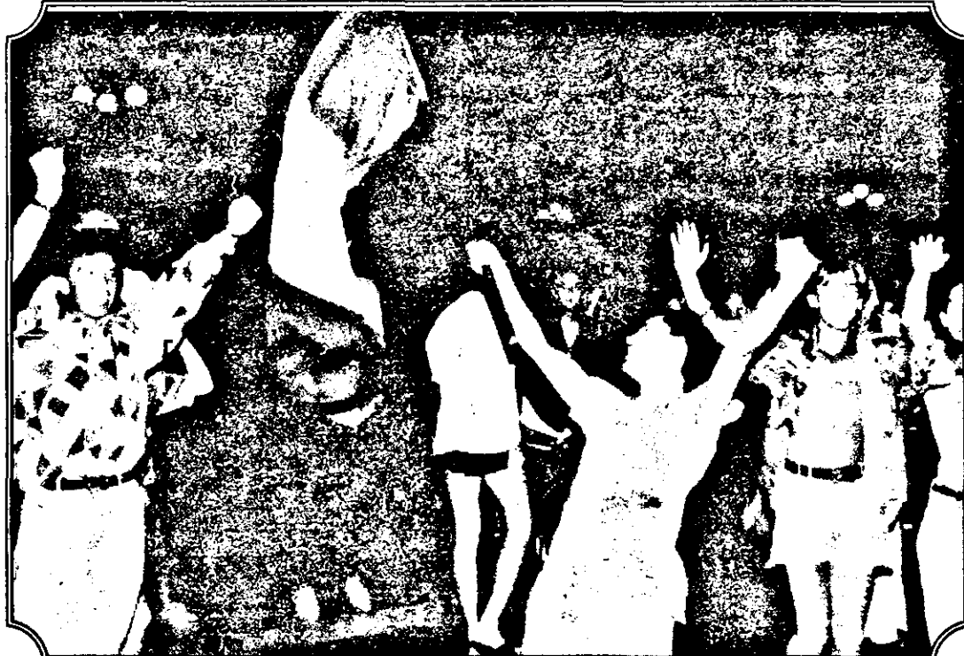
Arad. Plata Unirii. Orele 1.30-2. Bucurie mare. România a învins S.U.A. Suntem primii în grupă.