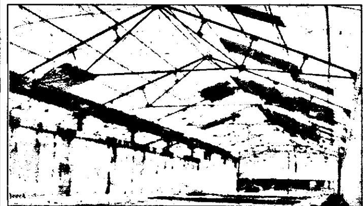
La fostul Complex de creștere a porcilor din Șiria, dacă altceva nu au putut fura (pereții fiind din beton) hoții s-au mulțumit ... și cu acoperișul.