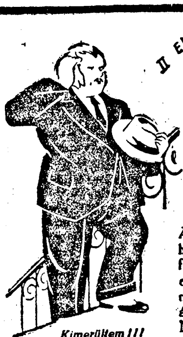
Kimerültem!!! URODONAL- kell ennem!