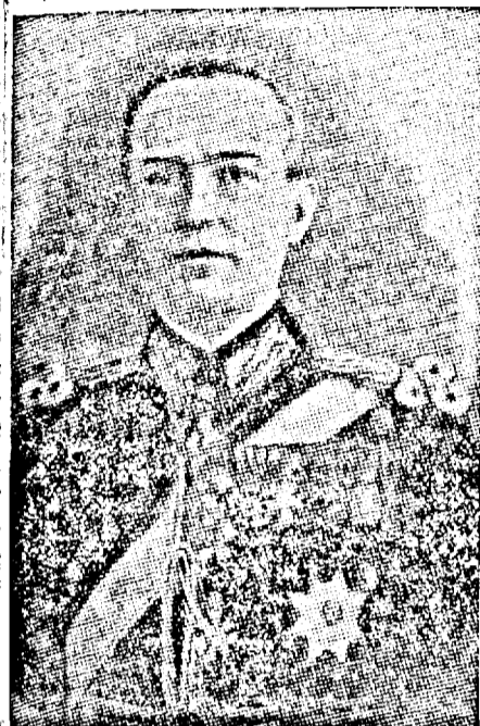
D. GENERAL ION ANTONESCU Conducătorul Statului

Discursul d-lui general Ion Antonescu la banchetul dat în onoarea d-lui Pellegrino Chigi