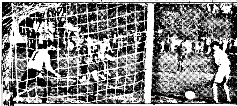
Fază din meciul de „Onoare”: Podgoria Ghioroc-Șiriana Șiria (scor 4-3).