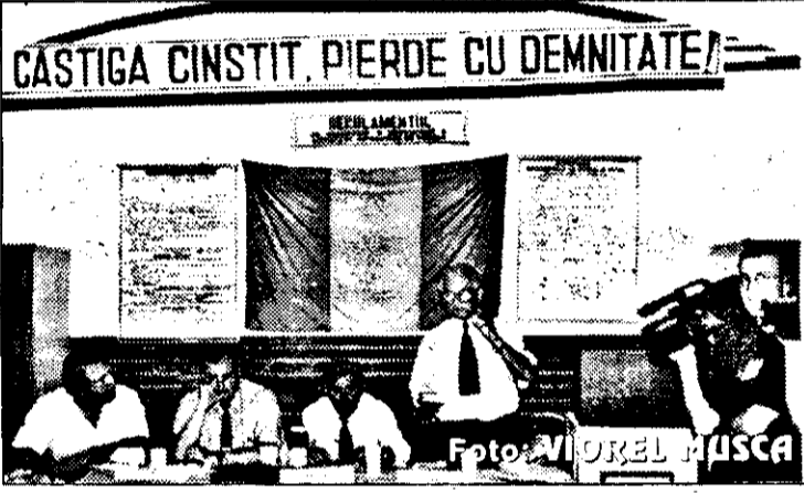
Mai marii ajejiști uită de cele mai multe ori de deviza: „căștigă cinstit, pierde cu demnitate.”

de adversar, nu este victimă dinainte. La fel de adevărat e și faptul că Tricoul poate pierde meciuri în momentul în care nu te aștepți, iar locul 7 este o consecință a acestui fapt. Și „șoimii” din Lipova au adus în partea inferioară a