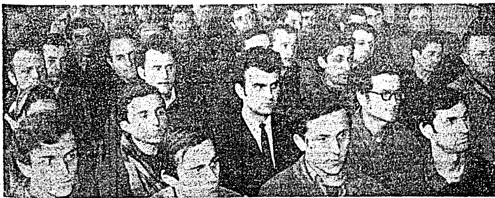
Au început dezbaterile în adunarea generală a comunistilor de la Sectorul II — lăcășurile — al Uzinei de vagoane.