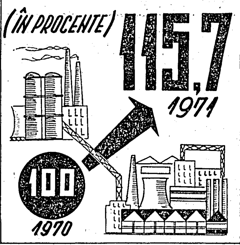
Volumul investițiilor din fondul statului alocate județului Arad.