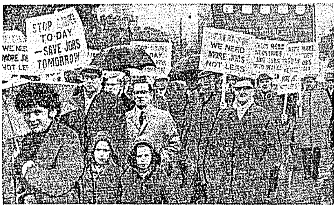
ANGLIA: Minerii din South-Wales au demonstrat pe străzile orașului Cardiff împotriva închiderii minelor.

partidul condus de el ar boicota alegerile anunțate pentru 1 iunie 1966. O altă știre anunță că secretarul general al ONU, U Thant, a informat pe membrii Consiliului de Securitate despre decretul guvernului provizoriu dominican privind vilttoarele alegeri generale în Republica Dominicană. După cum se știe, legea electorală promulgată în această țară prevede alegerea unui președinte, a unui vicepreședinte, a membrilor Congresului Național, a primarilor și a altor conducători locali, care își vor lua funcțiile la 30 de zile după data alegerilor.