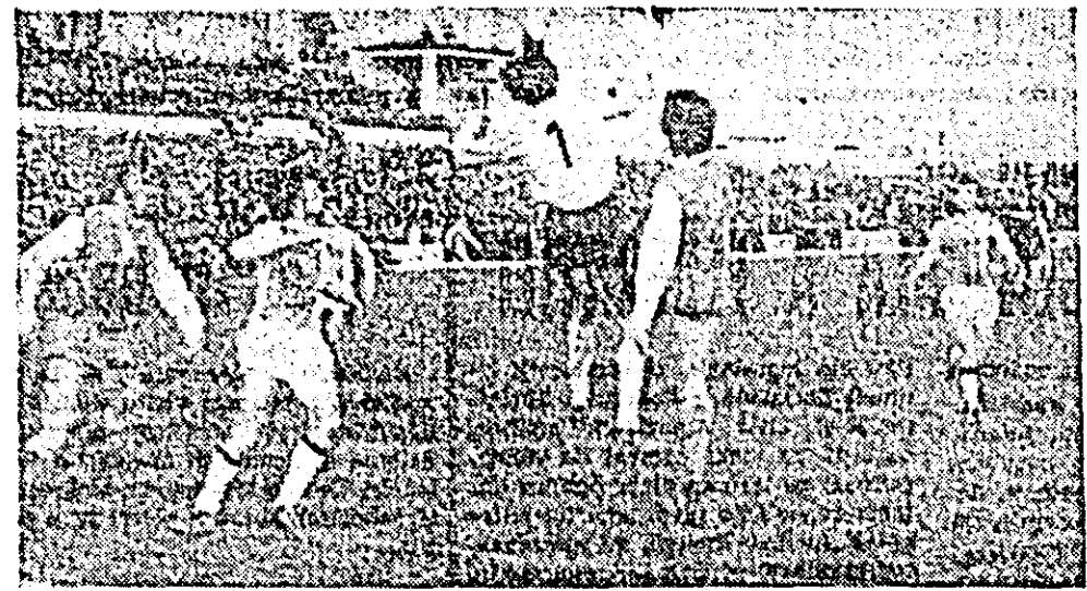
Fază din meciul UTA — Sportul studentesc.