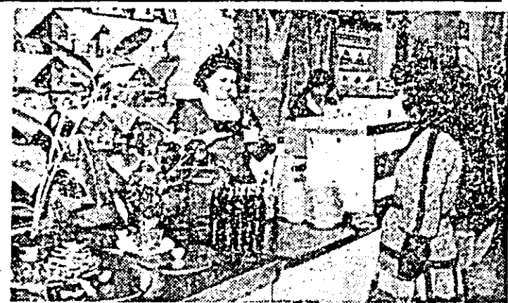
Cartierul Micălaca I sud: noua unitate „Gospodina” VII oferă un bogat sortiment de preparate și semipreparate culinare.

În cadrul „Săptămînei educației politice și culturii socialiste” din acest C.U.A.S.C. se vor organiza 96 de acțiuni în orașul Sebiș și comunele Birsa, Buteni, Cărand, Chisindia, Dezna, Ignești și Moneasa, în sprîjinul activității de producție în agricultură și industrie, de cunoașterea trecutului glorios de luptă al poporului român, de educație materialist-științifică, de educație sanitară, ori pentru o mai bună cunoaștere a legilor țării. Toate aceste manifestări sînt dedicate împlinirii celei de-a 60-a aniversări a creării Partidului Comunist Român.