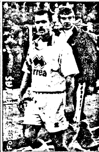
Pleci, Mariș, pleci?