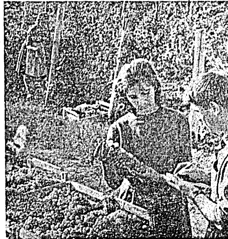
La gospodăria agricolă de stat Gaz recolta de struguri din acest an este bogată. Lucrătorii gospodăriei acordă multă atenție culesului strugurilor.