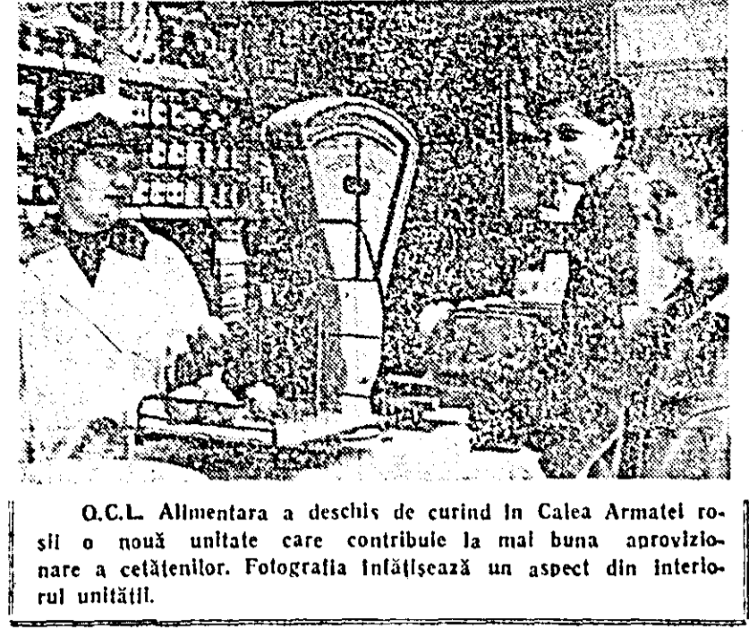
O.C.L. Alimentarea a deschis de curînd în Calea Armatei roșii o nouă unitate care contribuie la mai buna aprovizionare a cetățenilor...