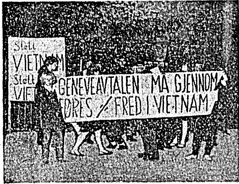
Tineri purtînd pancarte pe care se putea citi: „Cerem respectarea Acordului de la Geneva — pace în Vietnam”, au manifestat de curînd pe străzile orașului Oslo. În fotografie un grup de manifestanți.

Vorbind cu același prilej la posturile de televiziune, Wilson s-a referit, printre altele, la problema rhodesiană, relevînd că guvernul britanic continuă să dețină eforturi pentru a alunge la o rezoluție corectă. El a spus, de asemenea, că nu este în intenția sa de a recomanda dizolvarea actualului parlament englez în decursul acestui an, dar că, dacă evoluția situației din parlament va face imposibilă activitatea guvernului, s-ar putea recurge la o nouă consultare.