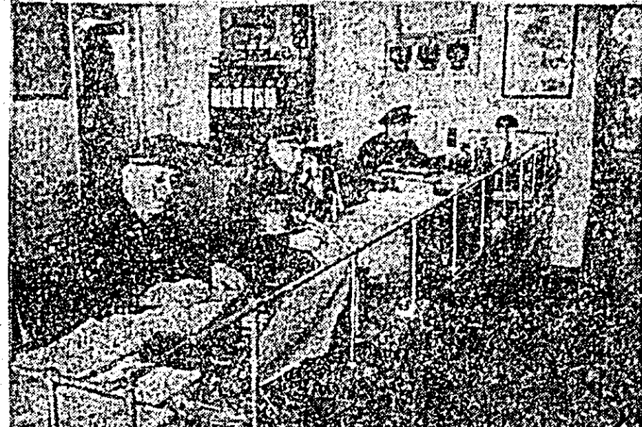
Zilnic, în gara Arad, sosesc și pleacă zeci de trenuri. Personalul din biroul de mișcare se străduiește ca circulația trenurilor să decurgă conform programului, în cele mai bune condiții. IN CLIȘEU: În biroul de mișcare din gara Arad.