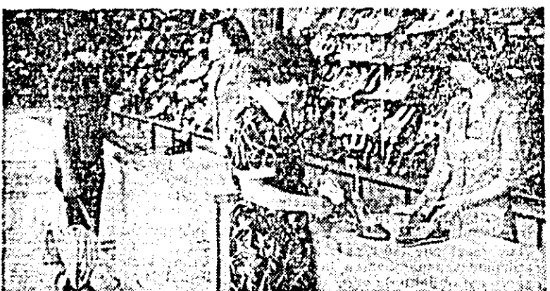
Magazinul de specialitate al cooperativei de consum din Nădlac oferă cumpărătorilor o gamă bogată de încălziminte de sezon.

• Duminică, la „Garofița”, unitatea a I.C.S.A.P., se găsea suc de mere și porto. Numai că porto nu se servea „pînă ce nu se va termina sucul de mere!”. Deci, vrei nu vrei, bea... suc de mere.