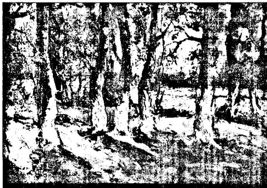
Pădure, iarna de Mihai Takacs