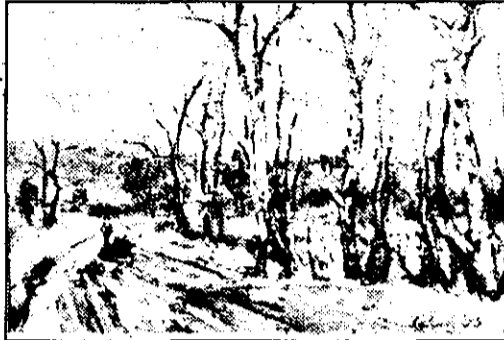
Potecă printre mesteceni