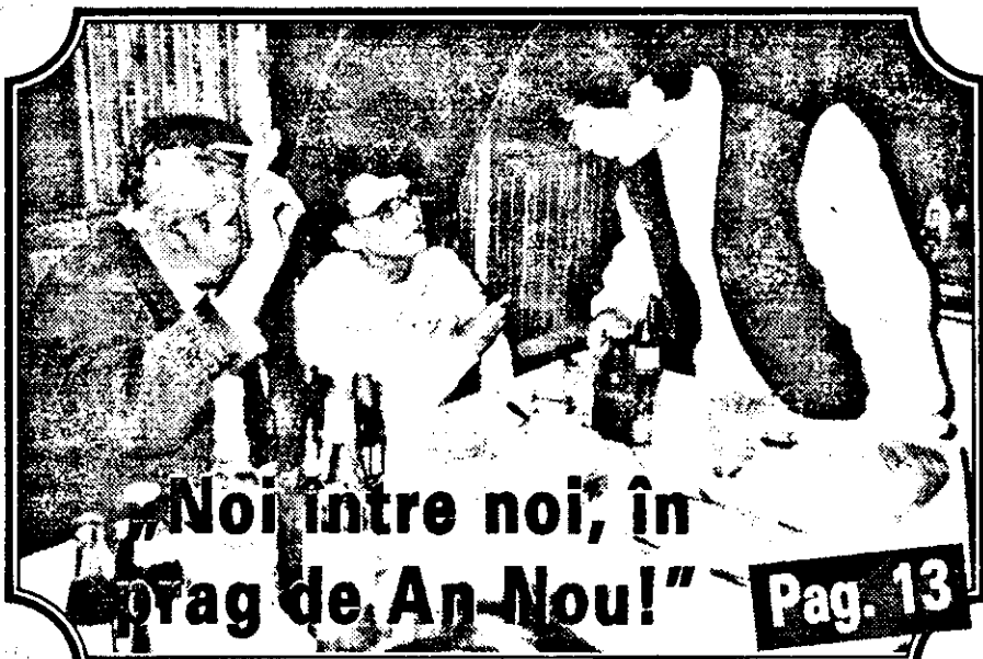
Noi între noi, în prag de An-Nou!