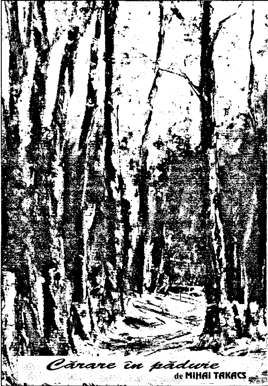
Cărare în pădure de MIHAI TAKACS