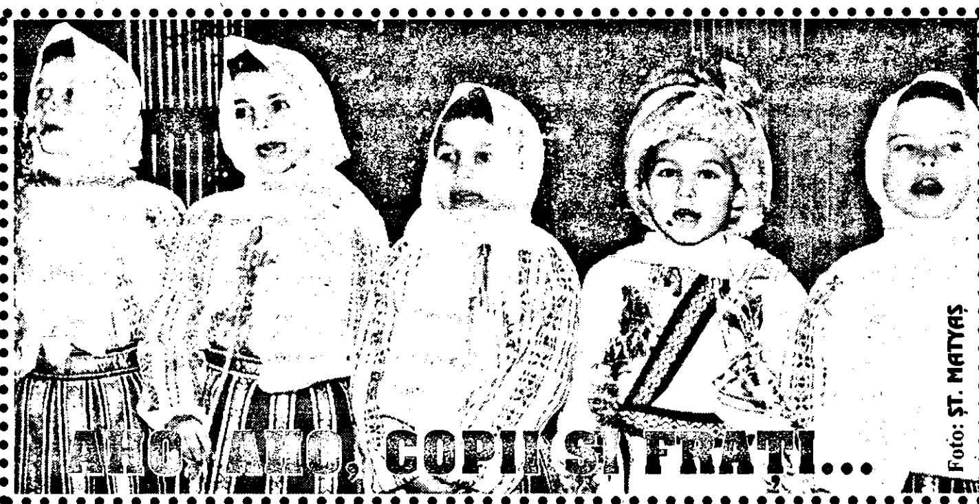
GOPII SI FRATI...

Severin, adăugând că viitorul românilor și al maghiarilor "se găsește în Europa și se realizează printr-un efort comun". Șeful diplomației române a lăsat să se înțeleagă că nu există nici un obstacol în redeschiderea consulatului ungar de la Cluj, transmite corespondentul MEDIAFAX la Budapesta. De asemenea, Severin s-a declarat de acord cu deschiderea unei reprezentanțe ungare la Constanța și a unei românești la Győr. În ceea ce privește diaspora românească, ministrul român de Externe a declarat că "trebuie să strângem relațiile cu românii din afara frontierelor țării, făcându-i să simtă că aparțin unei unice comunități: comunitatea spirituală a românilor de pretutindeni".