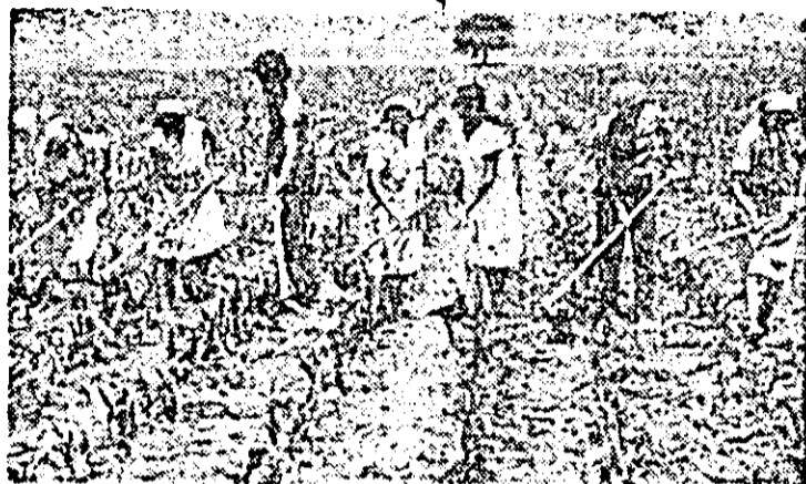
La întretinerea culturilor în unități din consiliul unice Chișineu Criș.

Au fost abordate, de asemenea, unele probleme internaționale, îndeosebi cele privind situația economică din Europa.