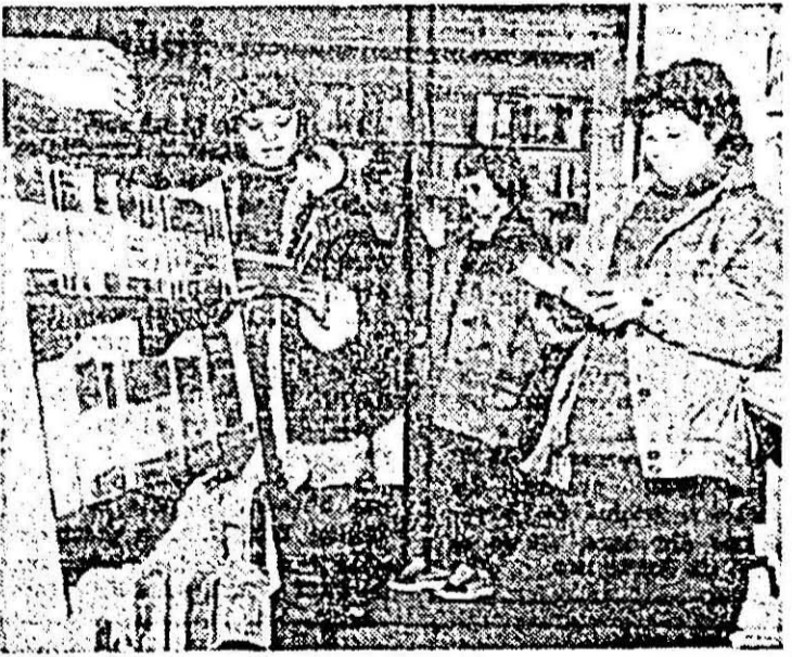
Aspect din librăria arădeană „Minerva”.