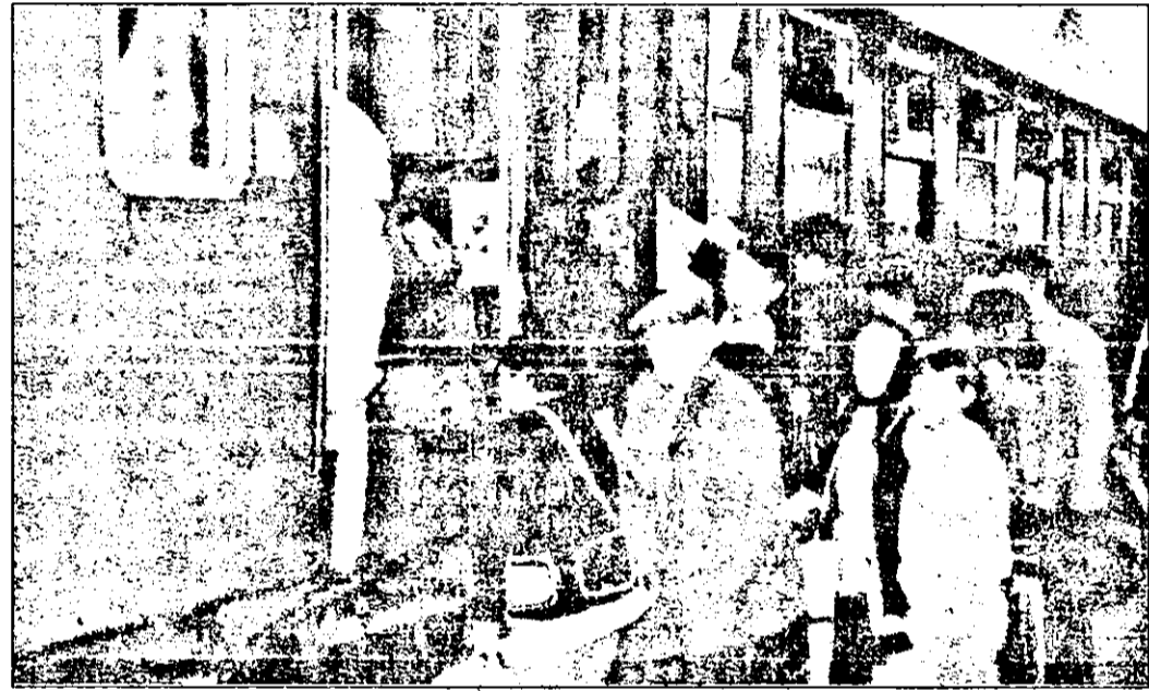
... doar aglomerația rămâne.