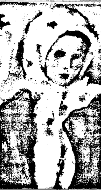
N. Tonitza - „Portret de fetiță” (Muzeul Județean Arad)

Poveste... Bergson și Platon ne avertizau însă că