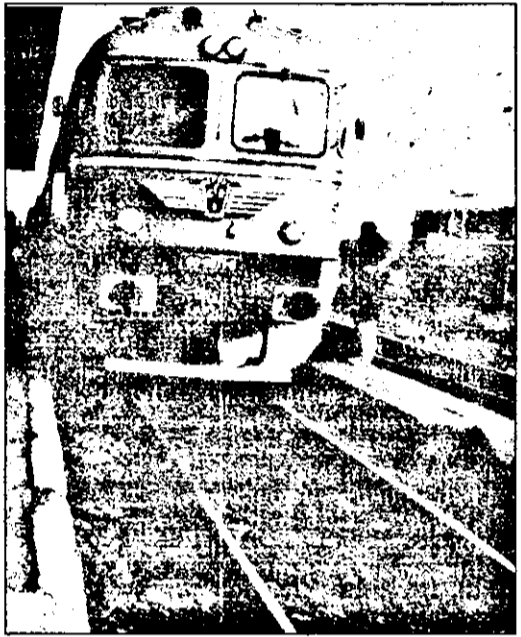
Trenuri pleacă, trenuri vin...

Pare greu de crezut că în prag de secol XXI, niște oameni mai pot călători într-o astfel de promiscuitate. Și totuși, miile de navetiști arădeni sunt nevoiți să o facă. Plătesc bilete de călătorie și abonamente tot mai scumpe, în timp ce condițiile de transport sunt tot mai lipsite de confort, mai necivilizate. Știm, ni se va