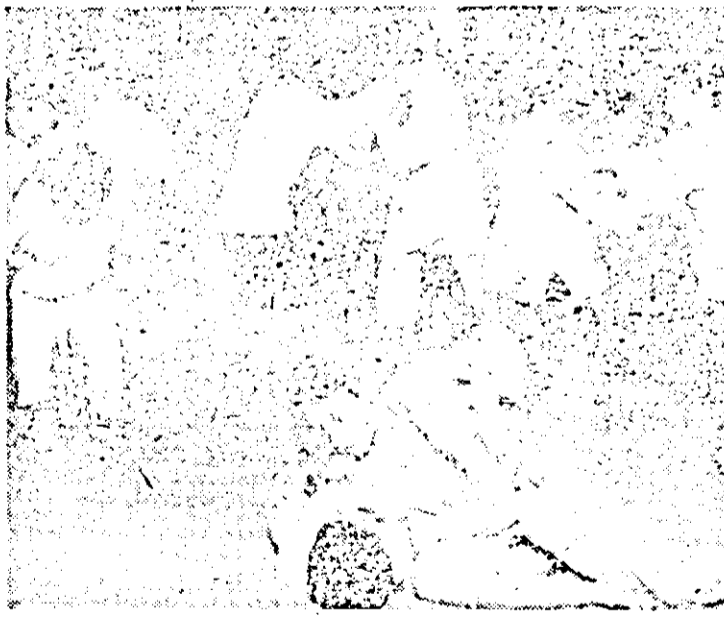
Aspect de la un antrenament al tinerilor judoka de la A.S. „Strungul” Arad.

Secția de judo de la „Strungul” se numără între puținele secții din țară, unde se pregătește un mare număr de fete. Grupa fetelor se împarte în