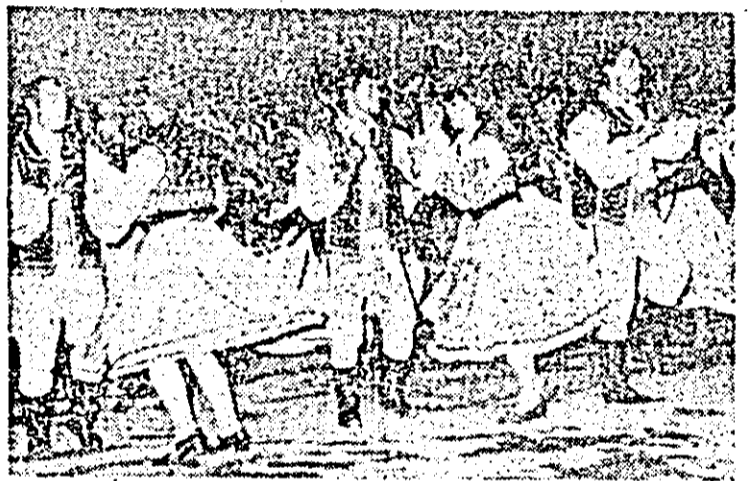
Formația de dansuri populare a Casei de cultură a sindicatelor, o prezență remarcabilă pe scena Festivalului Național „Cântarea României”.