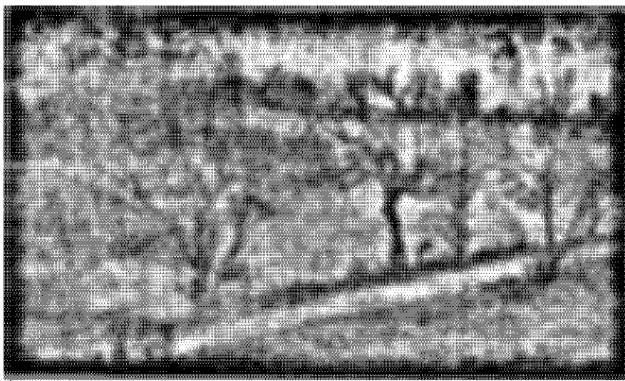
Apa trece. Mureșul râmbea.