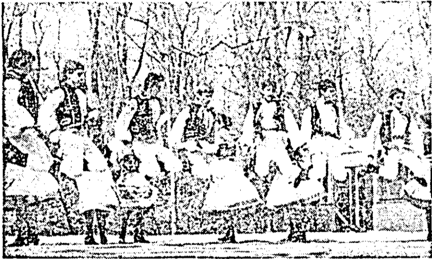
Joc și voie bună pe scena din pădurea Ceala...