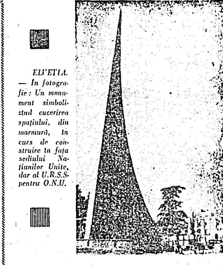
ELVETIA. — In fotografia: Un monument simbolic alucerii spațiului, din cursul construcției în fața sediului Națiunilor Unite, dar al U.R.S.S. pentru O.N.U.

MADRID 30 (Agerpres). — În învățământul superior spaniol se face remarcată, în ultima vreme, o stare de incordare, provocată de măsurile repressive adoptate de autorități.