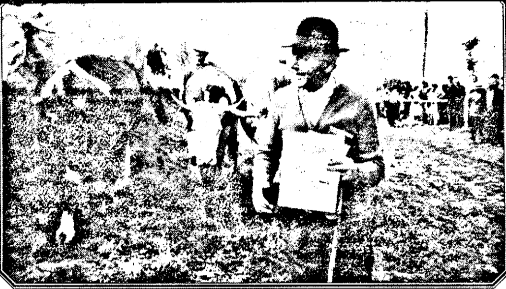
Ca în fiecare an, la „Târgul codrenilor” de la Văsoaia, atracția sărbătorii o constituie parada crescătorilor de animale.