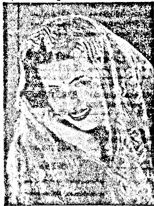
la casa Teatrului (Palatul Cultural).

Pentru concert care e așteptat cu mare interes de numeroșii amatori de muzică vocală pe cari îi numărăm Timișoara, ultimele bilete se pot reține la