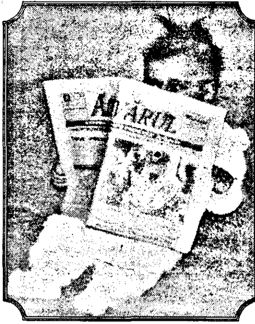
Mamăăă, ce știre senzațională!

Acum este immobilizată la pat. După o oră, o altă nenorocire: comandantul carabinieriilor care a transportat obiectele de la muzeu la cazarmă s-a simțit dintr-o dată rău și a fost dus la spital. În cazarmă domnește neliniștea. Care va fi muzeul ce va avea curajul să primească aceste obiecte? Și ce soartă a avut cel care a abandonat caseta în fața Institutului Dadato?