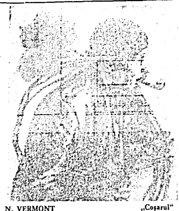
N. VERMONT „Coșarul”

ilustrație de carte, exprimîndu-se în pictura murală, în cea de sevălet, în gravură și în desen. Atras de aspectele vii ale realității inconștante și cu deosebire de cele dramatice ale societății burgheze, Nicolae Vermont a dat o serie de opere ca: „Muncitorii la masă”, „Emigranții”, „În gară”, „Coșarul” și altele care se păstrează la Muzeul Republicii Socialiste România. Angrenat pe linia inițiată de marii noștri artiști Nicolae Gri-gorescu, Ion Andreescu și Ștefan Luchian, fondatorii școlii de pictură românească modernă, Nicolae Vermont a adus o contribuție meritorie la dezvoltarea artei noastre plastice în primele decenii ale secolului al XX-lea.