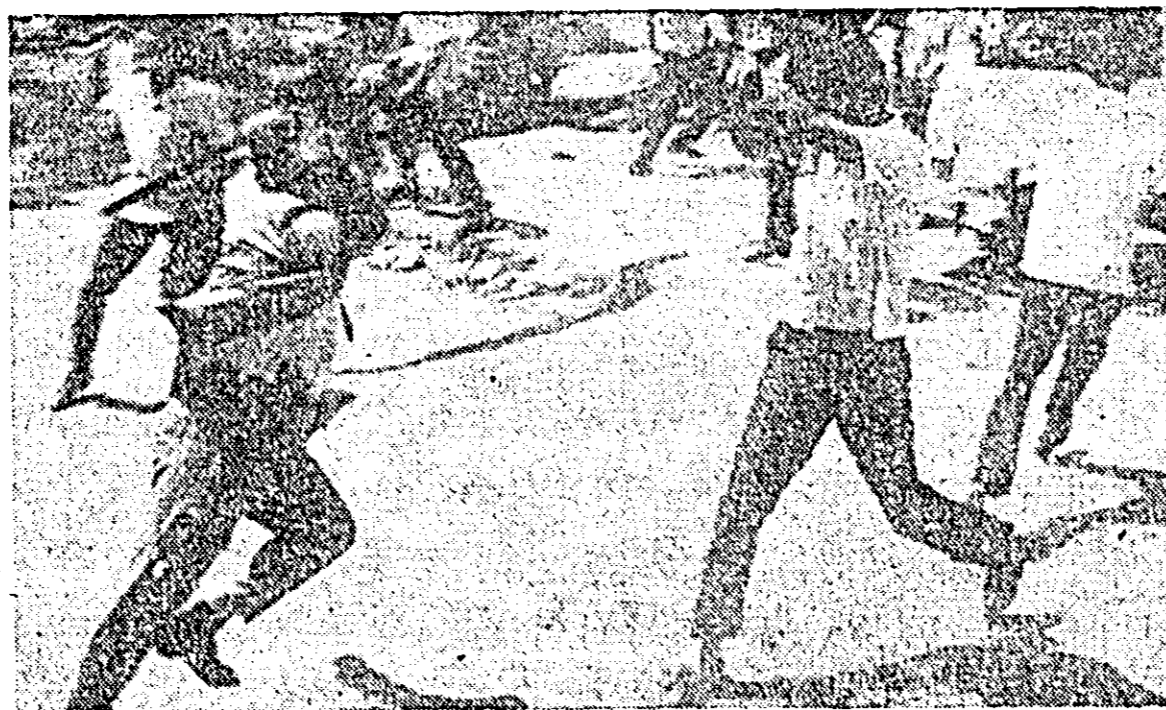
BRAZILIA. Poliția încearcă să refîntă cu forța studenții care protestează împotriva amestecului guvernului în treburile interne ale Universității din Rio de Janeiro.