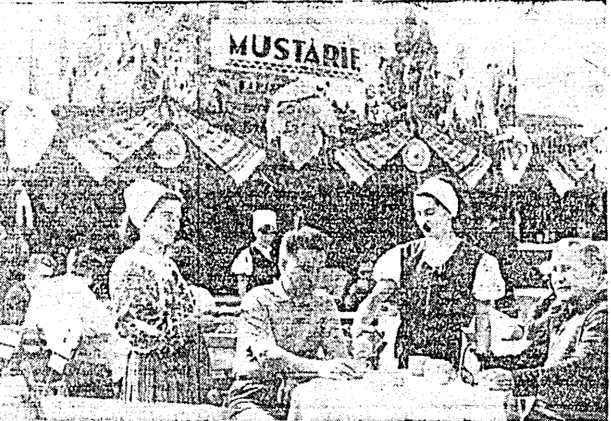
Mustăria din Piața Pompierilor dispune de must dulce și aromat, servit în condițiile unui cadru tradițional, adecvat sezonului.

Valoric, eficacitatea noului dispozitiv poate fi apreciată la cel puțin un milion lei economii, pe calea creșterii productivității muncii.