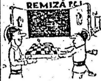
Fără comentarii. Caricatură de IOAN KETT-GROZA