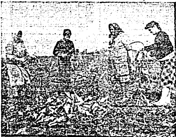
C.A.P. Felnac. Recoltatul sfeclei de zahăr se desfășoară pe ultimele suprafețe.

Pentru aceasta, la nivelul fiecărei localități au fost mobilizate toate forțele manuale și mecanice disponibile, la cules fiind antrenați atît membrii coope-